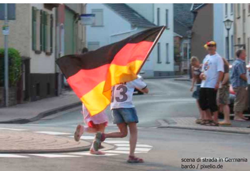
scena di strada in Germania

monacensi, non sempre hanno questa consapevolezza, spesso pensano che tutte le città siano come Monaco e si avventurano in quartieri non del tutto sicuri in città come Rio o Chicago.