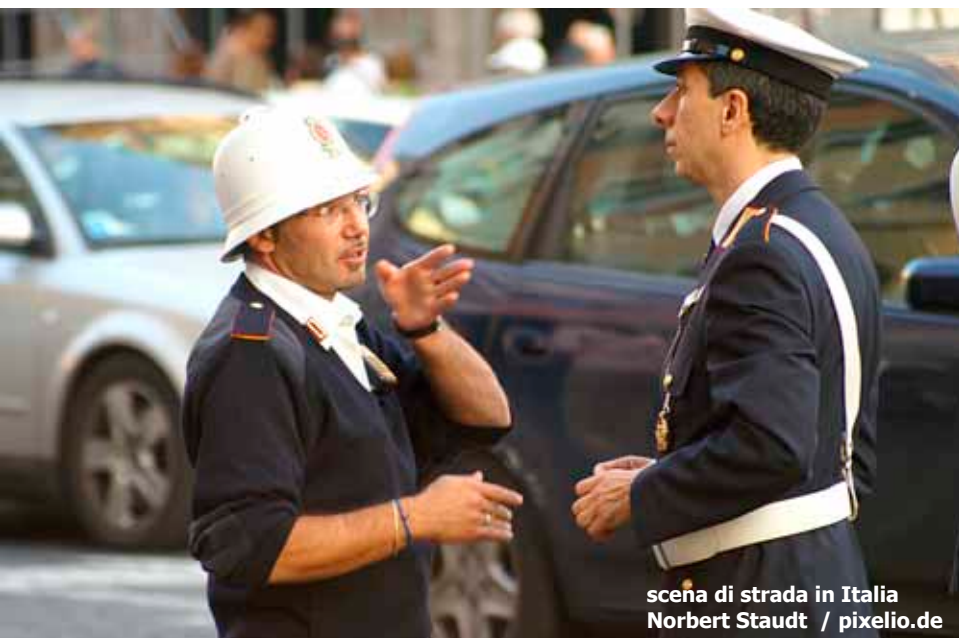
scena di strada in Italia