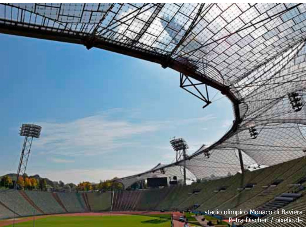
stadio olimpico Monaco di Baviera

coppa Rimet); i portieri che giocavano ancora senza guanti e a mani nude; la capigliatura da hippie di molti dei giocatori olandesi (e di qualche tedesco); lo storico match, il primo e unico tra le nazionali maggiori, che vide contrapposte le due Germanie ad Amburgo il 22 giugno e che vide clamorosamente trionfare la DDR per 1 a 0. Ma sicuramente l'immagine più curiosa è legata all'arbitro della finale, l'inglese Jack Taylor, che sceso in campo, con tipico humor britannico, lodò ampiamente la splendida organizzazione tedesca per poi indicare con l'indice i quattro angoli del campo e aggiungere: "... Ma non è che vi scoccerebbe mettere anche le bandierine del calcio d'angolo, visto che le avete dimenticate?" (Simone Cofferati)