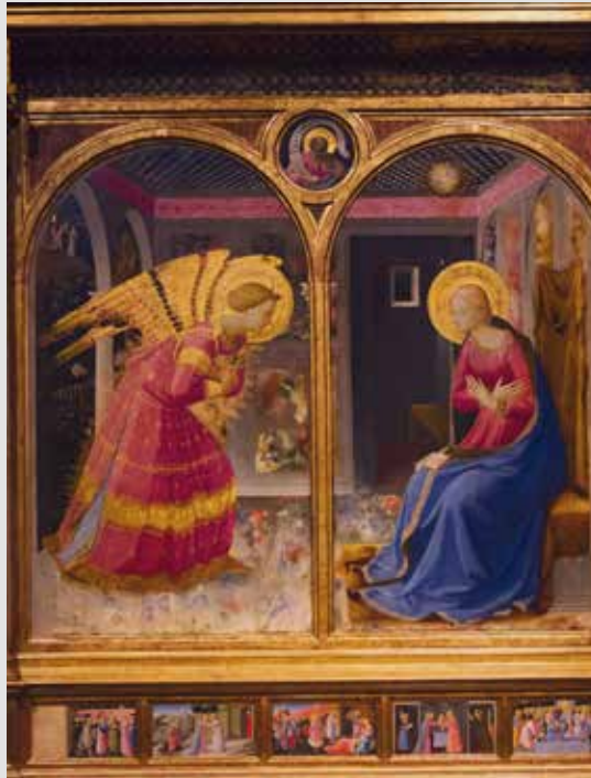
L'Annunciazione di Beato Angelico

Se non avessi visto l'angelo del Beato Angelico a Palazzo Strozzi (Firenze) non mi sarei mai accorta dell'esistenza dei colori. Non si tratta né di daltonismo, né di cataratta, che pur m'affligge, ma di un fenomeno coscienziale. Vedere è un atto talmente spontaneo che ci rende ciechi per la maggioranza del tempo. Siamo vedenti/cechi di colori.