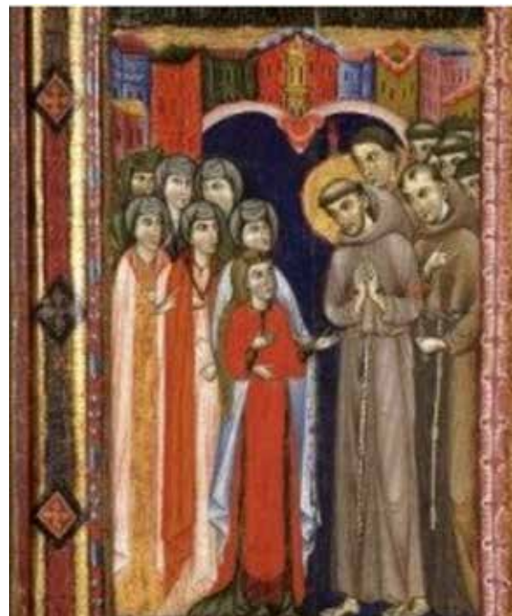
Pala di Santa Chiara - particolare

Ciò nonostante, decisero di abbandonare ogni cosa della loro precedente vita, casa, famiglia, ogni loro avere, diventando consorelle di Chiara, le Clarisse, se pure osteggiate dalle rispettive famiglie, che tentarono con ogni mezzo di convincerle a desistere e a ritornare alla vita di prima. Da ricche, da nobili, scelsero di farsi povere sfidando la prassi, le leggi sociali, culturali e anche religiose del loro tempo. Al fine di adoperarsi per il bene degli