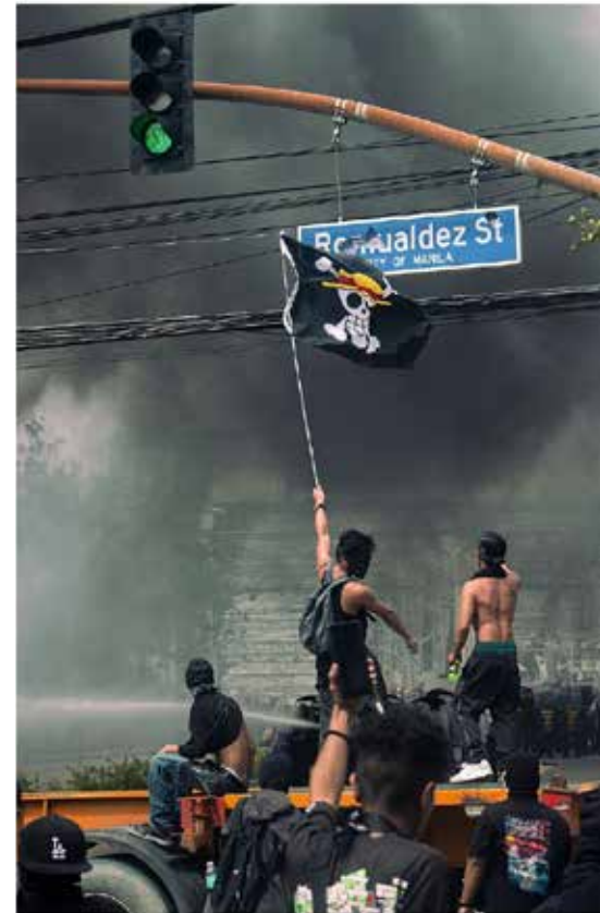
Straw Hats' Jolly Roger in una protesta a Manila, simbolo proveniente da una serie che narra di pirati-ribelli, e ormai usato in movimenti di protesta della Generazione Z in almeno dodici paesi

Se consideriamo le quattro grandi ripartizioni estere come blocchi unitari, infatti, solo gli italiani residenti in altri Paesi europei hanno respinto la proposta del referendum. Tra gli italiani residenti in Europa, dice sempre il sociologo, si noterebbe la nostra identità politica di stampo progressista. Un'occhiata alle ultime elezioni della Camera dei deputati lo