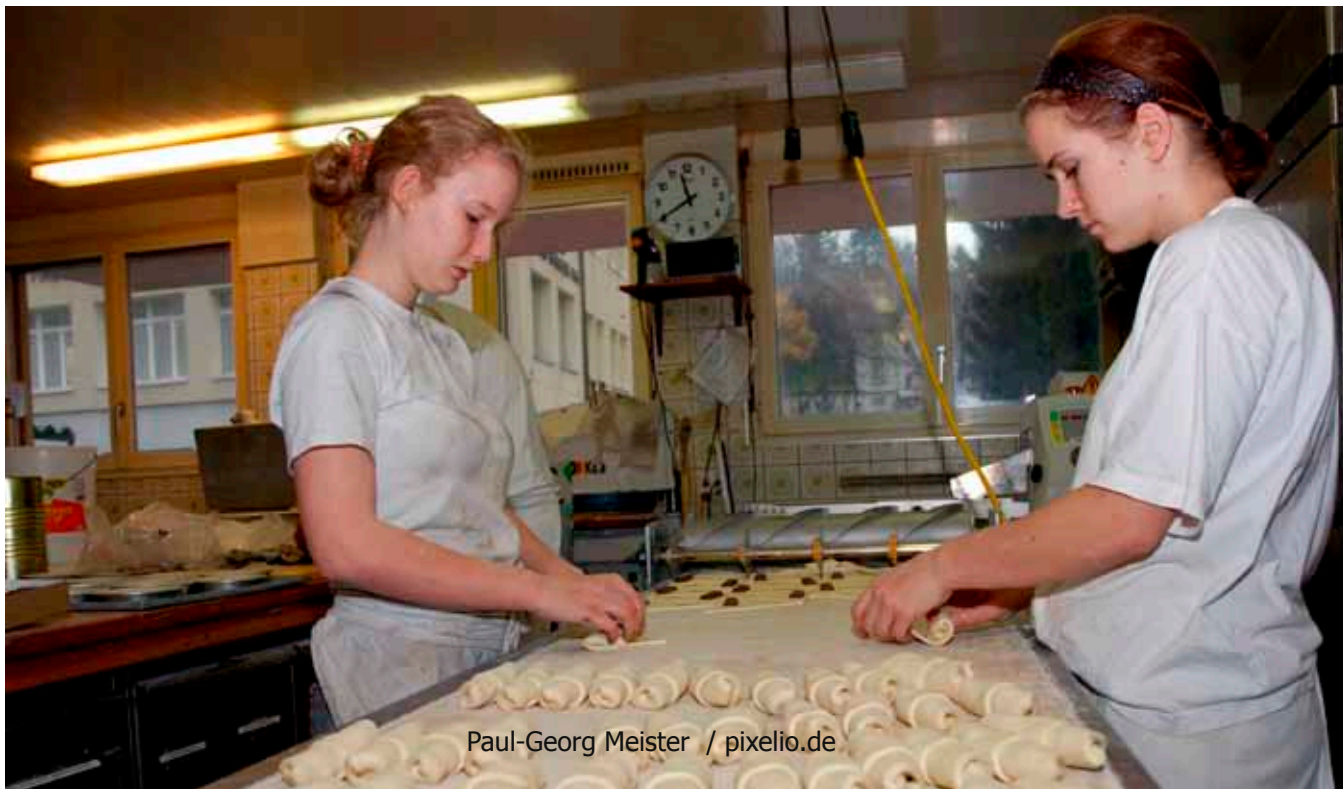
Paul-Georg Meister / pixelio.de