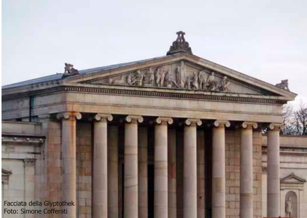
Facciata della Glyptothek

Come il gemello Staatliche Antikensammlungen (museo delle antichità), la Glyptothek fa parte del progetto architettonico e museale di Ludwig I, che decise di dotare la capitale del suo piccolo regno mitteleuropeo di un polo museale, con sede a Königsplatz, che contenesse collezioni di arte antica che potessero rivaleggiare con quelle delle altre grandi capitali europee: Londra, Parigi, Berlino, Roma. La Glyptothek fu, in particolare, il primo degli edifici di questo polo a venir costruito, tra il 1816 e il 1830, da Leo von Klenze, uno dei due architetti di punta del neoclassicismo tedesco. E più neoclassica di così la Glypto – come comincio a chiamarla dopo un po' – proprio non poteva esserlo, quel 13 ottobre 1830 quando venne aperta al pubblico con le sue colonne ioniche e la facciata di marmo, a richiamare la classicità greca all'esterno, e