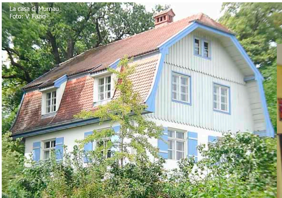
La casa di Murnau