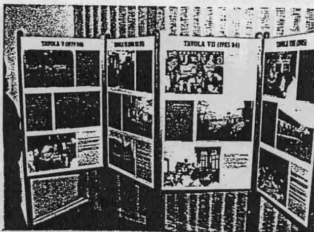
1° maggio al Rinascita: mostra: 'Dalle baracche all'ingegneria genetica'

pi in Germania, ma anche in Italia, il Rinascita, rifiutando ogni tentazione nazionalista, non ha esitato ad appoggiare una lista di solidarietà internazionale. Nel 1992, al compimento del mercato unico europeo con l'intensificarsi ed il diversificarsi dei movimenti migratori ad esso collegati, l'apertura non solo formale del nostro (segue p. 2)