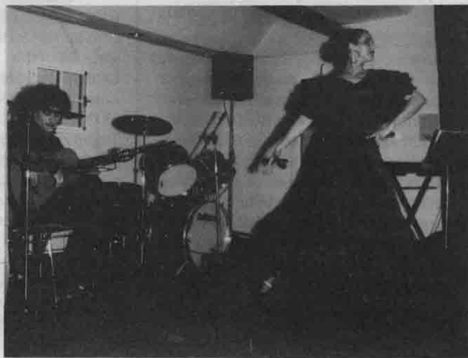
Im Bild die Gruppe Flamenco Morato, eine der Hauptattraktionen des heurigen Rinascita-Fest. Mehr dazu und zum Wettbewerb "Kennen Sie -Bayern" auf Seite 6.