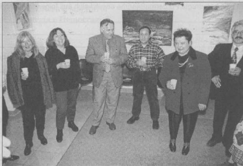
Il brindisi di fine anno del rinascita e.V.