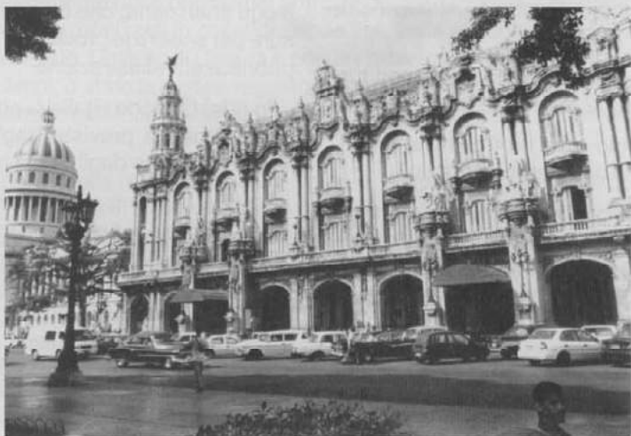
Gran Teatro in L'Avana, Cuba

In questo periodo storico di rapido progresso tecnico abbiamo nelle nostre mani "due atomi", come li definì il pensatore Ernesto Calducci, capaci di sconvolgere il nostro Pianeta: la fissione nucleare che sappiamo può portare alla distruzione di tutti gli esseri viventi e l'ingegneria genetica o biotecnologia che, permettendo di modificare il DNA delle cellule viventi a piacere, può portare alla fabbricazione di sottouomini, ossia di schiavi.