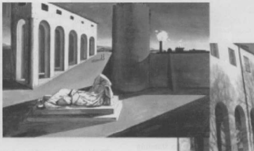
Giorgio de Chirico, „Freuden und Rätsel einer seltsamen Stunde“, 1913. Die Architektur des Münchner Hofgartens diente als Kulisse für mehrere Bilder, die beispielhaft für die „pittura metafisica“ sind.