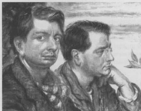
„Die Dioskuren“: unzertrennlich, aber jeder schaut in andere Richtung... Fragment des berühmten „Selbstbildnisses“ mit dem Bruder, Giorgio de Chiricos von 1924.

Es wurde überliefert, dass in späteren Jahren die Brüder in der Abwesenheit Dritter fast nie miteinander gesprochen haben. Sie verbrachten die gemeinsame Zeit... schweigend.