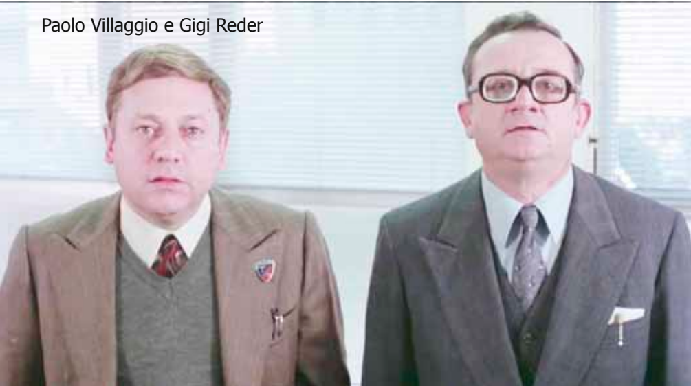
Paolo Villaggio e Gigi Reder

da antologia), lo guardo e lo ri-guardo sempre volentieri, anche in film che non sono esattamente dei capolavori: da "Rimini Rimini" a "Fracchia la Belva Umana", dalle "Comiche" a "Scuola di Ladri", fino a "Ho vinto la Lotteria di Capodanno", al bel "Io speriamo che me la cavo" e nella sua intensa interpretazione ne "La Voce della Luna", l'ultimo film di Fellini. Per un certo periodo ho pensato che se Paolo Villaggio fosse stato americano e si fosse chiamato Paul Village, forse sarebbe stato osannato in tutto il mondo come un genio della comicità, quasi un Woody Allen. Poi mi sono reso conto che Villaggio è troppo italiano per doverlo condividere con altri. E a lui, francamente, penso fregasse poco della sua popolarità.