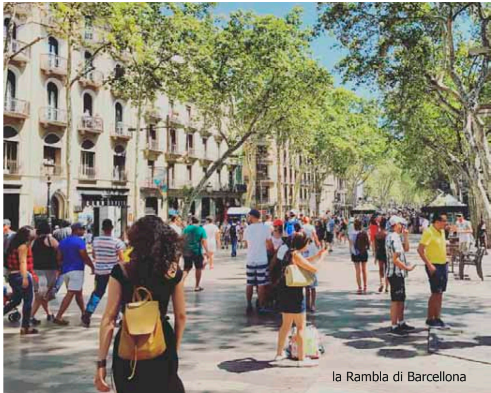
la Rambla di Barcellona

Serve che lo gridiamo forte, che non smettiamo di farlo. Serve che tutti, non solo la nostra generazione, capisca che i disperati che arrivano ai confini del nostro Paese, sono spesso in fuga da quegli stessi invasati che hanno preso possesso del loro Paese e che cercano di seminare il terrore anche in Europa. Il terrore non ha faccia, non ha colore, non ha nazionalità. La paura che pervadeva la gente in fuga sulle Ramblas è la stessa che spinge molti migranti a spendere i pochi risparmi rimasti per salire su un barcone e affrontare il mare, senza la certezza di arrivare. L'incertezza è di nuovo protagonista. Quella europea è più limitata, al lavoro, alla possibilità di avere un'adeguata vita sociale, di poter pagare gli studi ai nostri figli. Quella di molti migranti è l'incertezza di un pasto per sé e per i propri figli, l'incertezza di avere sufficiente acqua, l'incertezza di sopravvivere a una banale