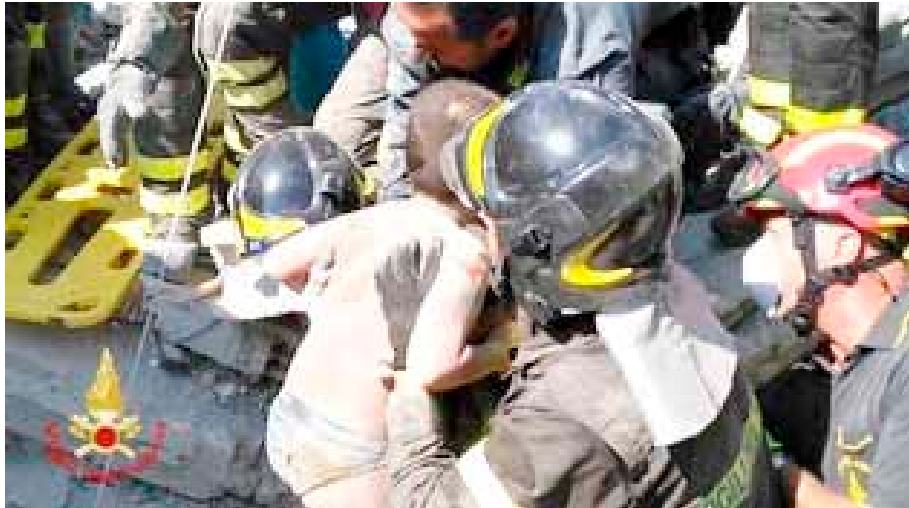
vigili del fuoco in azione ad Ischia

Le preoccupazioni sono dettate, innanzitutto, da ragioni ambientali: la vicinanza di Ischia con i Campi Flegrei – che dal 2012 sono in allerta gialla – e il Vesuvio ha suscitato apprensione nella popolazione, e non solo. Sebbene gli esperti abbiano tranquillizzato sui possibili collegamenti tra i vari focolai campani, i timori restano vivi. Il vero boom mediatico post terremoto non riguarda tanto gli aspetti