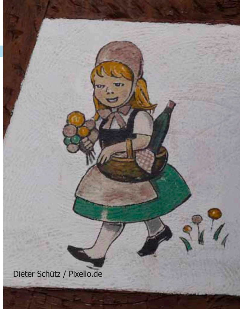
Dieter Schütz / Pixelio.de

Certo, avrebbe potuto cercare un po' più a lungo e trovarne una un po' meno distante. Ma Cappuccetto era d'accordo su un aspetto: madre e figlia devono stare ad una certa distanza di sicurezza. Volentieri se ne sarebbe andata a vivere dall'altra parte del bosco anche lei. Non con la nonna magari, anche se meglio con la nonna che con la madre.