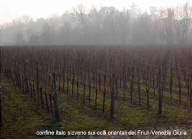
confine italo sloveno sui colli orientali del Friuli-Venezia Giulia

Per il giorno del "Ricordo" (1) da diversi anni ricevo inviti dai Comuni per trattare in modo semplice questo tema, poiché mia madre è stata profuga istriana nel secondo dopoguerra a causa del difficile confine orientale. In modo semplice è sempre difficile, consentitemi il gioco di parole. E nonostante io sia una docente da oltre trent'anni, trovo l'argomento ogni volta più spinoso. Ovvero, l'argomento è sempre lo stesso ed oggi mi è più chiaro perché poi faccia così male: degli "estranei" decidono il da farsi, dove fissare il confine, e poco importa se questo divide in due il tuo orto, patate qui, verze lì e vai col passaporto a raccogliere quanto è finito in Slovenia, sempre che ci sia ancora. A Parigi andava tutto bene, sicché pochi pianti e lamenti.