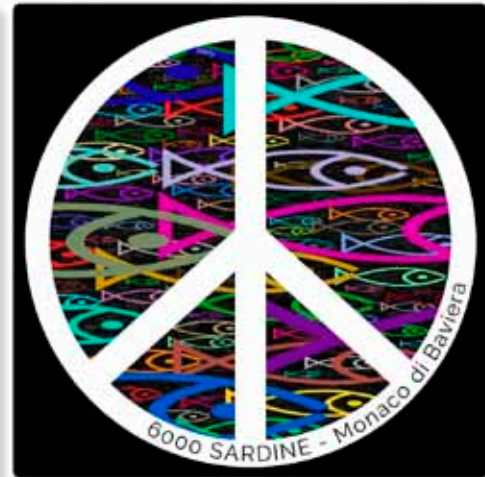
manifestazione delle sardine a Monaco di Baviera

sindaci di paesi come Kutzenhausen o Dachau, o inviano minacce di morte addirittura ai capi della polizia, e dove i populistici prendono sempre più piede. La situazione è gravissima in molti altri posti del mondo.