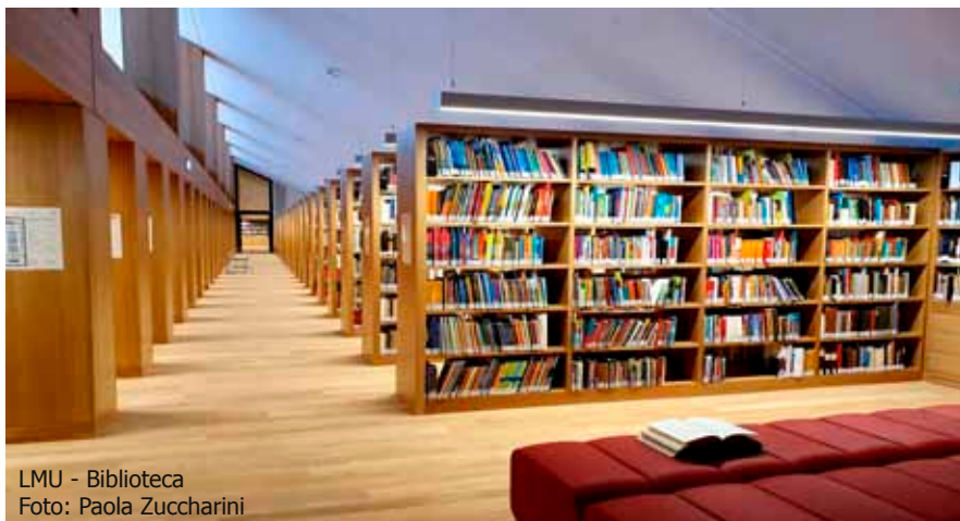
LMU - Biblioteca