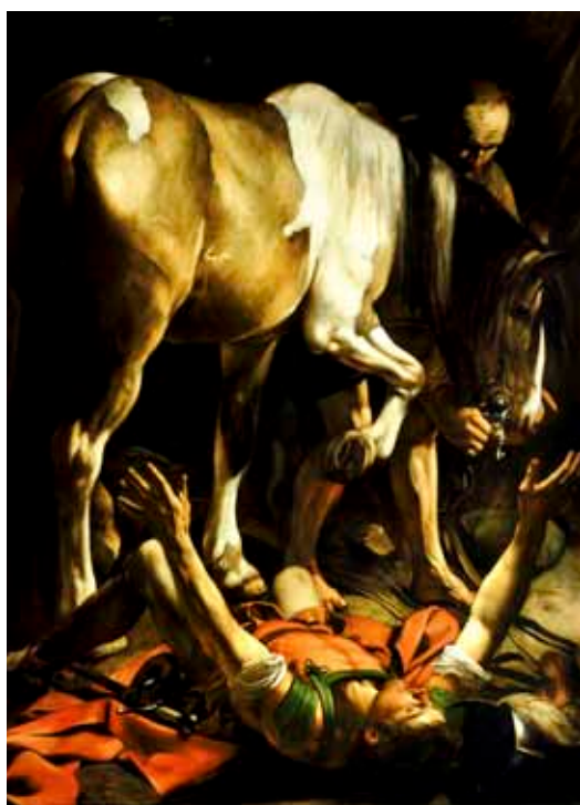
Saulo di Tarso folgorato sulla via di Damasco

la controcopertina, l'indice, e infine sfogliarlo delicatamente, sentire il fruscio delle pagine. Un grande esempio.